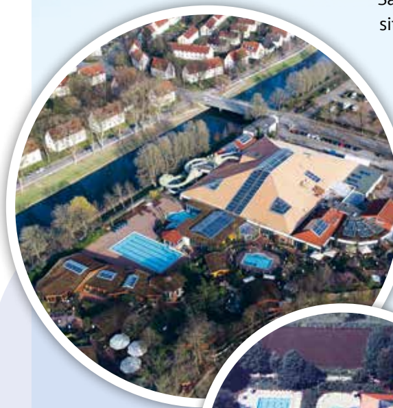
Das H2O in Herford heute (oben) und im Jahr 1998

Und dieses 25-jährige Bestehen möchte das H2O